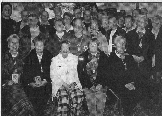
Die Senioren-Schützen freuten sich über ihre Medaillen.