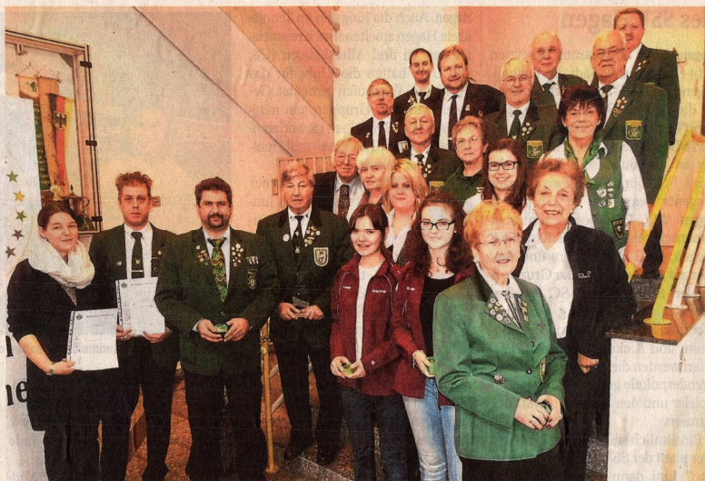
Zahlreiche Schützen wurden bei der Kreisdelegiertentagung ausgezeichnet.